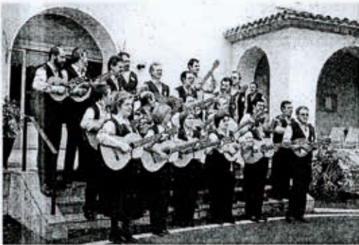
La Rondalla Alaitasuna y Santikutz Abesbatza ofrecen esta noche una actuación conjunta por el centro de Legazpi.