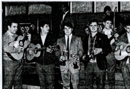
Gordoa y el resto de miembros del conjunto Alaita (R. ALAITASUNA)

Como el año pasado, también esta noche se añadirá al repertorio clásico de esta ronda la canción San Juan Legazpi , con letra aportada por Legazpi Bertsolariak Bertso Eskola y música adaptada de la canción popular vasca Dios te Salve . La idea es que con el paso de los años se convierta en la canción tradicional de los San Juanes en Legazpi. Junto los componentes de Santikutz Abesbatza como de la Rondalla Alaitasuna quieren hacer partícipes a todos los legazpiarras de la magia que la ronda proporciona a esta noche. Una noche en la